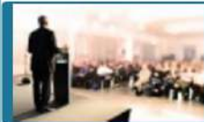
Actes de séminaires